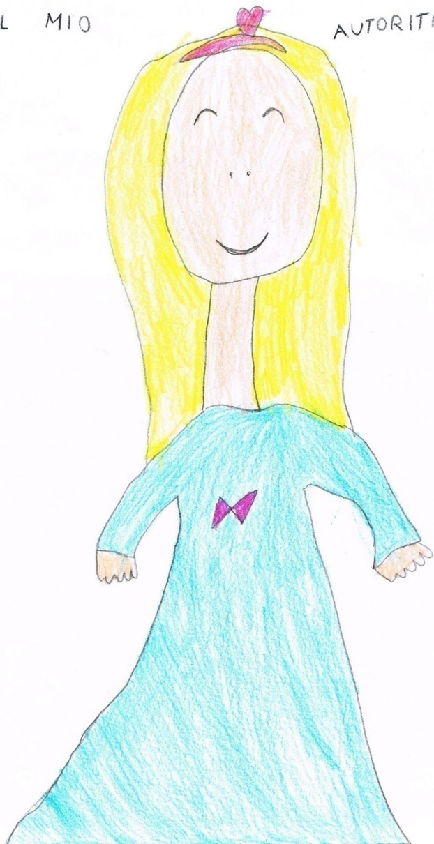
Il mio autoritratto