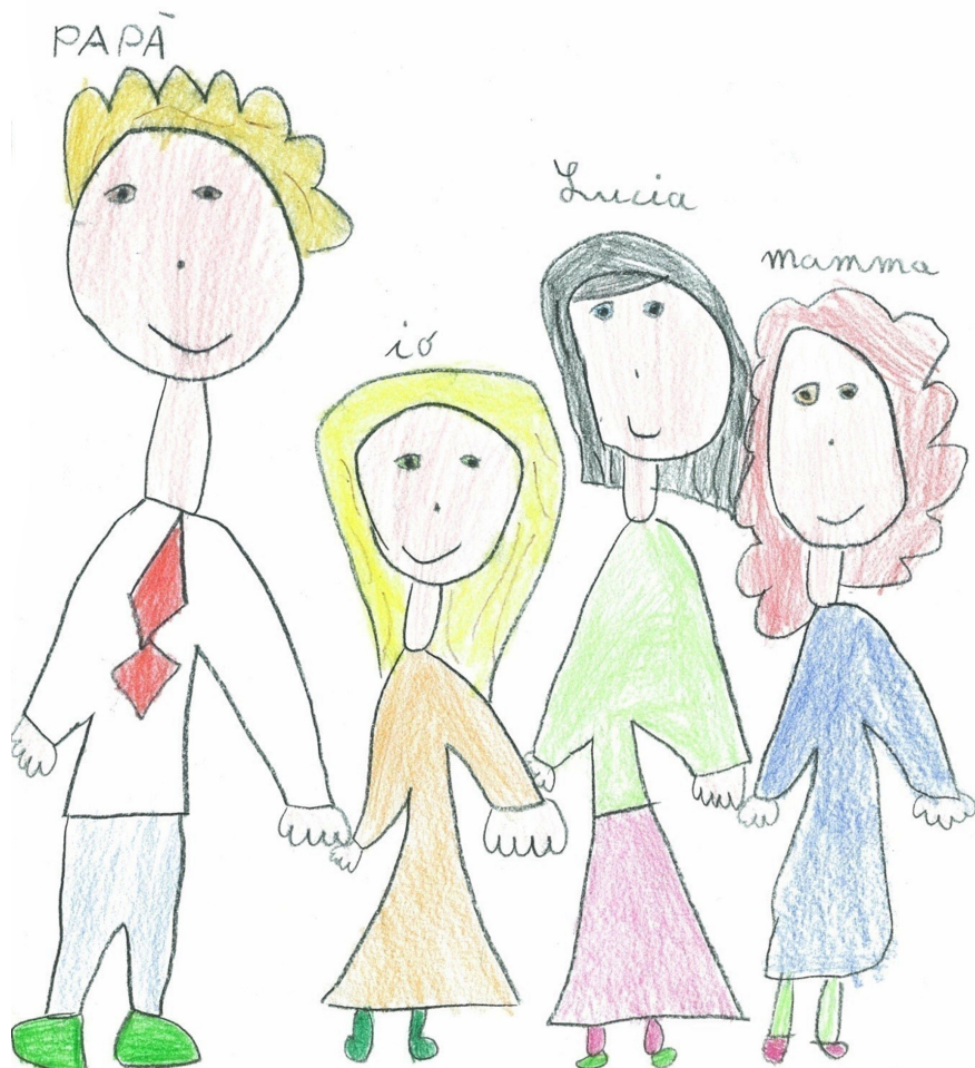
La famiglia che vorrei